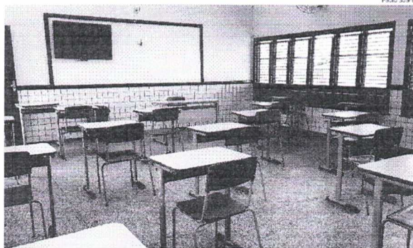
A queda das matrículas nas escolas em todo o Maranhão já vinha sendo constatada desde 2018

Quando avaliado o percentual de matrículas com distorção idade-série